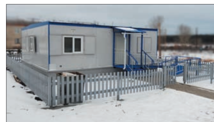
Фельдшерско-акушерский пункт (ФАП) в с. Пульниково