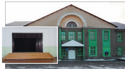
Печеркинский ДК. Проведен ремонт зала.

цам Советская, Мелиораторов, организовано спиливание тополей по ул. 8 Марта, 10, 12. Выполнены работы по ремонту вентиляции и утеплению потолков в доме № 156 по пер. Школьный а в р.п. Пышма, прогрейдирована дорога по ул. Сибирская, ул. Набережная.