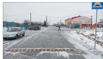
Возле Ощепковской СОШ. «Лежачий полицейский»

Администрация Пышминского городского округа в данном выпуске информационного бюллетеня представила информацию о выполнении отдельных мероприятий по решению вопросов, поставленных жителями Пышминского городского округа на выездных приемах, и по выполнению поручений по результатам встреч главы Пышминского городского округа с жителями населенных