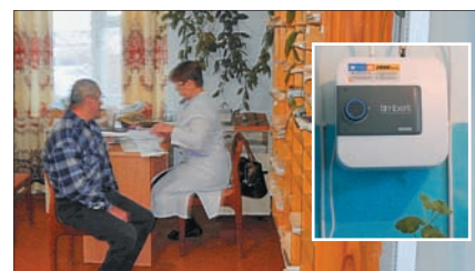
ФАП в с. Юрмытское. Проведен ремонт отопления.